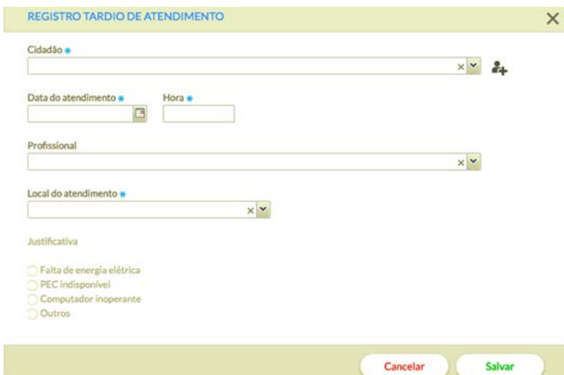
Figura 3. Registrar atendimento tardio